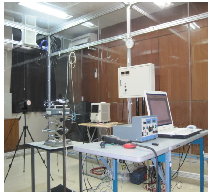
中央研究所デモルーム