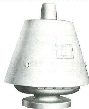
< プレッシャーレリーフバルブ >