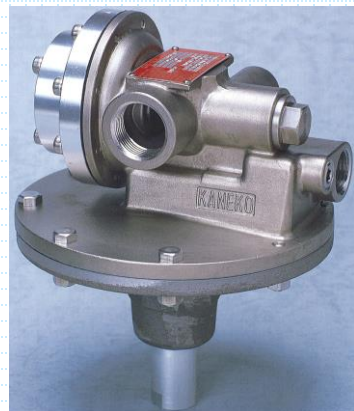
< ガスシールユニット >

また、微圧設定のため、シールガスの使用量を最小限に抑えることができ、経済的な運転が可能です。